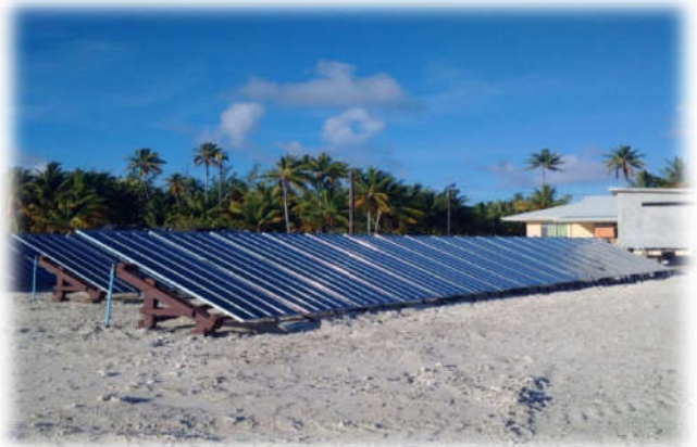
CAROCELL™ 2000 – Xử lý nước biển thành nước ngọt