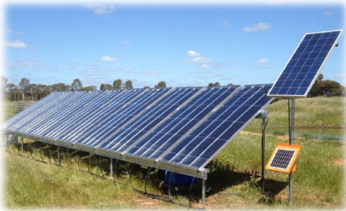
CAROCELL™ 2000 – Xử lý nước bần vận hành tự động không cần điện