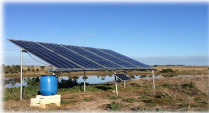
CAROCELL™ 3000 – Xử lý nước bần thành nước ăn uống