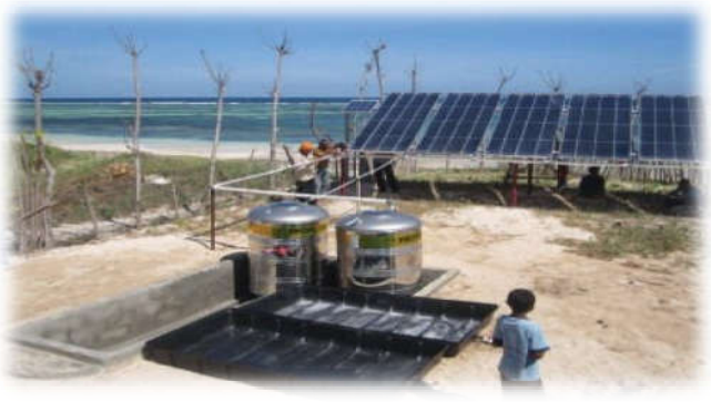
CAROCELL™ 3000 – Xử lý nước biển thành nước ngọt