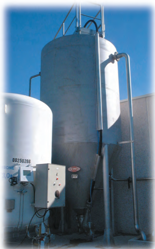
KSF 5-2 - Khử photpho trong xử lý bậc 3