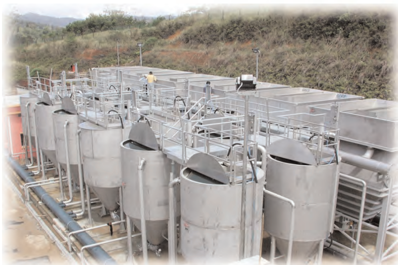
KSF 5-1 - Chuyển giao dự án xử lý nước uống