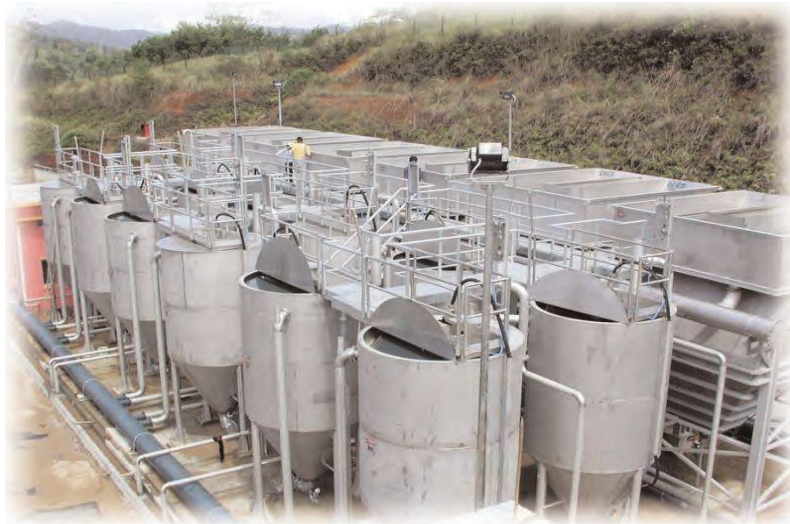
KSF 5-1 - Chuyển giao dự án xử lý nước uống