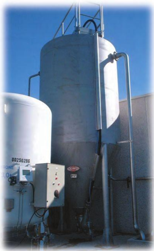
KSF 5-2 - Khử photpho trong xử lý bậc 3