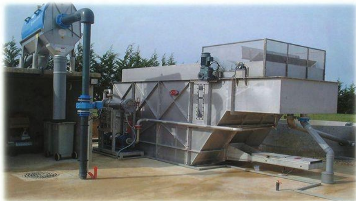
UNC 50 - Xử lý dầu mỡ trong nước thải sản xuất thực phẩm