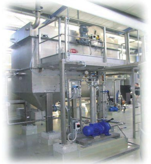
UNC 15 - Xử lý dầu mỡ trong nước thải sản xuất thực phẩm